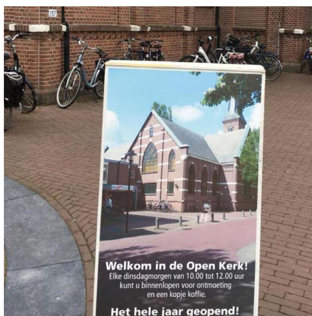
Open Kerk in Ermelo