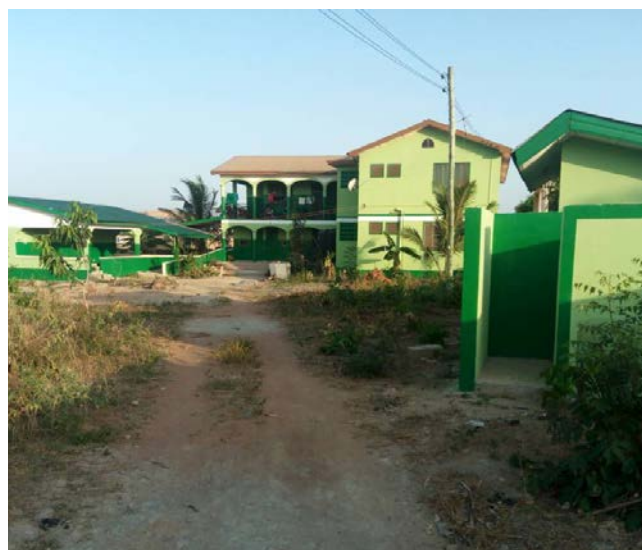
De kliniek in Olebu

Het is de bedoeling dat de kliniek, met de verworven inkomsten, zichzelf in stand zal kunnen gaan houden. In de toekomst is het zelfs de hoop en verwachting dat we met een deel van de inkomsten kunnen bijdragen aan onze projecten in het noorden van Ghana •