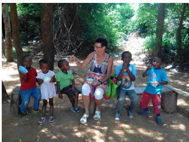
Picknicken met de kleinsten in Olebu

Een aantal van mijn pleegkinderen en kinderen uit het Sandema fosterhome zijn inmiddels volwassen of volwassen aan het worden en het is fijn om te zien hoe elk op eigen manier en naar eigen kunnen zich inzet voor het werk van Onyame. Het spreekwoordelijke gezegde dat vele handen licht werk maken, gaat binnen de projecten zeker op.