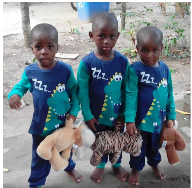
De kleintjes pronken met hun nieuwe pyjama's en knuffels